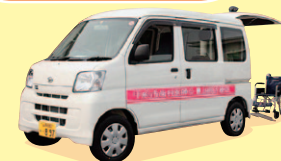
甲府市歯科医師会 訪問診療車