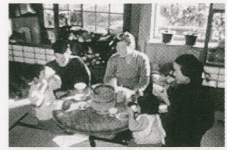
昭和9年当時の、ある家族の食事風景。ちゃぶ台の中央にごはんのおひつが鎮座し、一汁一菜の献立が並ぶ。

情動的な共感を求めているに違いありません。この老人は、現在の状況では、健康で生き甲斐をもって充実した日々を送ることはできません。