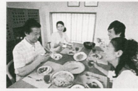
現在の、ある家族の食事風景。食の多様化がすすみ、洋食風の食べ物が食卓を彩る。

最近、自分がある行動をしている時に活性化される神経細胞でありながら、その行動を他者がしているのを見ている時にも同じように活性化される神経細胞が発見されました。他の個体の行動に対して、まるで自身が同じ行動をしているかのように“鏡”のような活動をするこの神経細胞はミラーニューロンと呼ばれ、今まで心理学で言われていた「共感」の仕組みもこのミラーニューロンの存在にあってと考えられるようになりました。ミラーニューロンが他人への共感を呼び起こし、人と人とのコミュニケーションを促す役割を果たしているとするれば、他人の身振りや